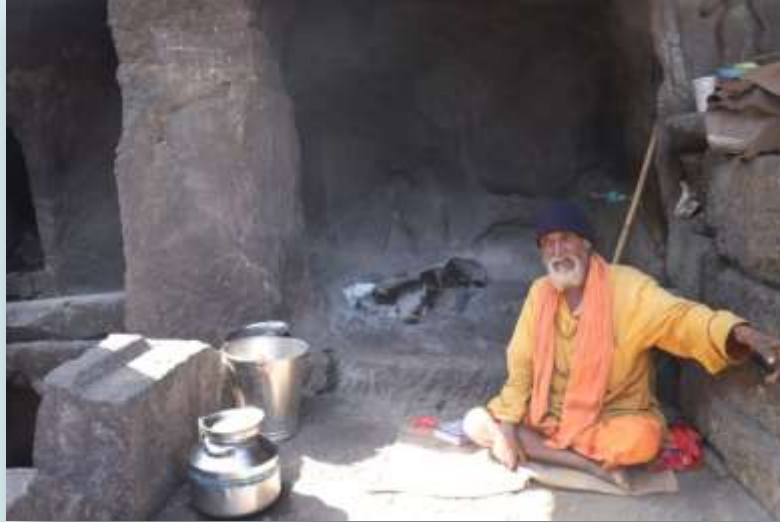
मंढीराच्या मागील आजूष वास्तव्यास अक्षणारे 'साधू' महाराज...