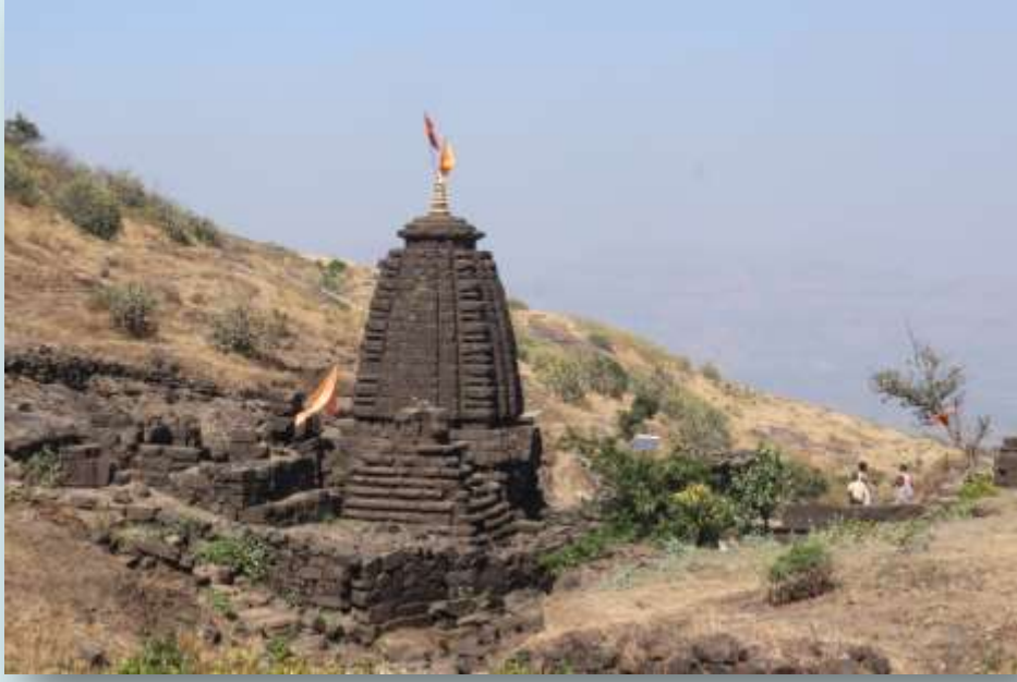
कोकणकड्यावरुन हरिश्चंद्रेश्वराच्या मंदिराकडे जाताना काढलेला फोटो...